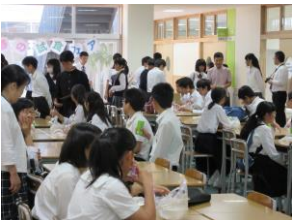
とにかくおいしい倉敷高校の手作り学食

オープンスクール最後の企画として、食堂のメニューを試食できる企画を実施し、チャーシュー丼、チキン南蛮丼、牛丼といった、三種の丼を用意しました。用意された丼は完食で大盛況のうちに終了しました。