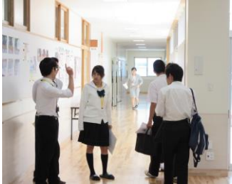
先輩に質問を深めることができました。

今春完成した新校舎を紹介しながら、高校生活を知ってもらう企画として校内見学ツアーを行いました。