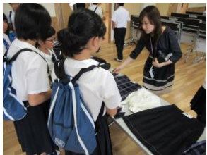
ポラロイド写真を用意し、参加者は自身が高校生になった雰囲気を感じました。初めての制服に袖を通し満足した表情でした。

一足先に高校生になつてみる！？ 各体験講座終了後、本校制服を用意し、制服試着会を行いました。