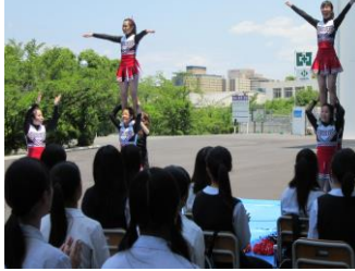
ダンスを行うチアリーディング部。拍手が溢れる姿がみられました。

今年より部としてスタートした本校チアリーディング部がパフォーマンスを行いました。