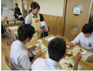
自分で作ったクレープをほおばる姿がみられました。

本校の家庭科の教員を中心に、様々な食材を入れたクレープをつくる体験講座を行いました。