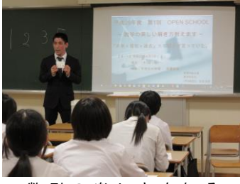
数列の楽しさを伝えることができました。

「数学の美しい解き方を教えます」と題し、高校数学の楽しさを知ってもらうことを目的に数学の体験講座を行いました。