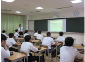
初耳の鶴亀算の認識ができました。