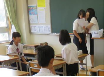
ヒントは耳打ちで伝えられる可能性を挑戦しました。