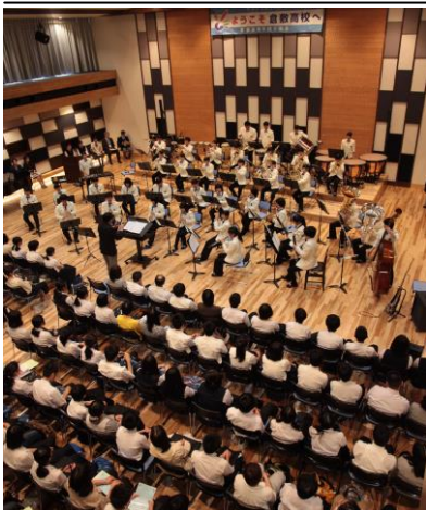
オープニングでの吹奏楽部による歓迎演奏

体験講座においては、新校舎を余すことなく利用し、「①高校生活の面」、「②勉強の面」、「③部活動の面」といったテーマに沿った内容で倉敷高校のことを参加者の皆さんに紹介しました。また、学食の試食や制服試着なども企画されました。